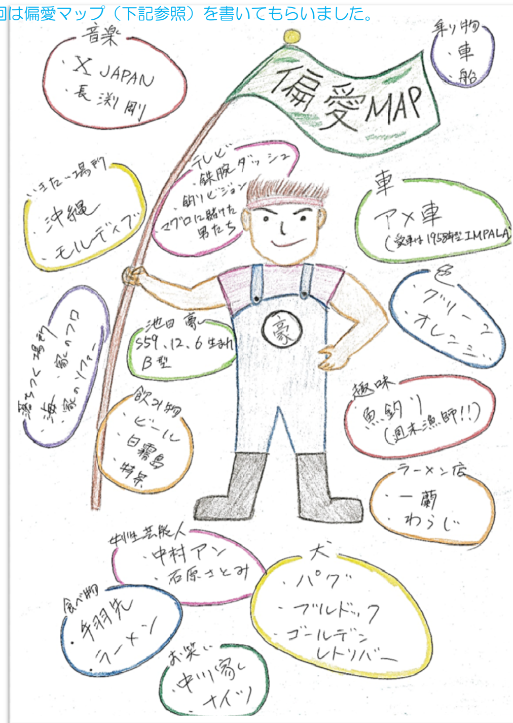
※偏愛マップとは、1枚の紙(A4のペーパー)に、自分の偏愛するものをキーワード方式に書いたもの(マップ)である。