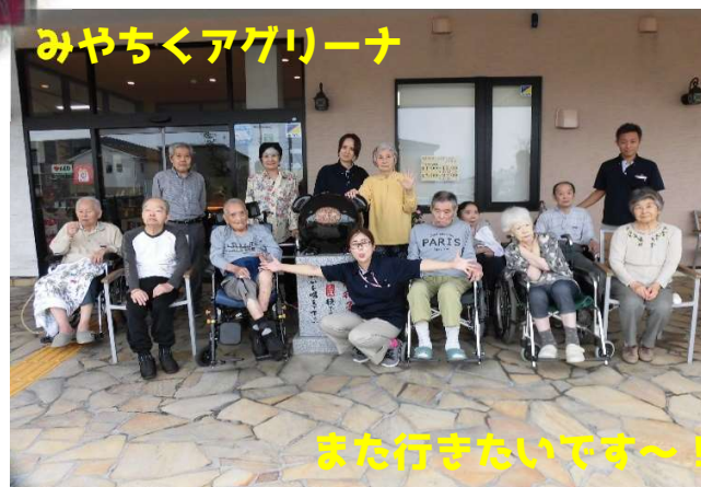
また行きたいです～！