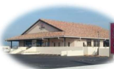
みやちくアグリーナ