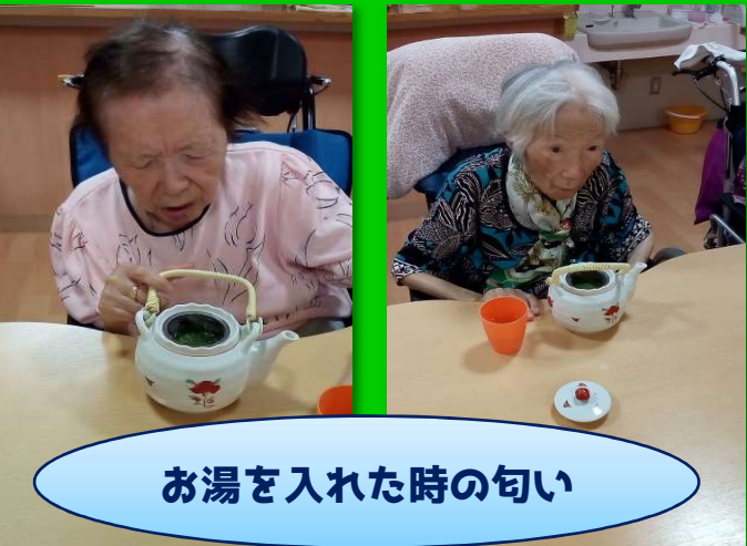
お湯を入れた時の匂い