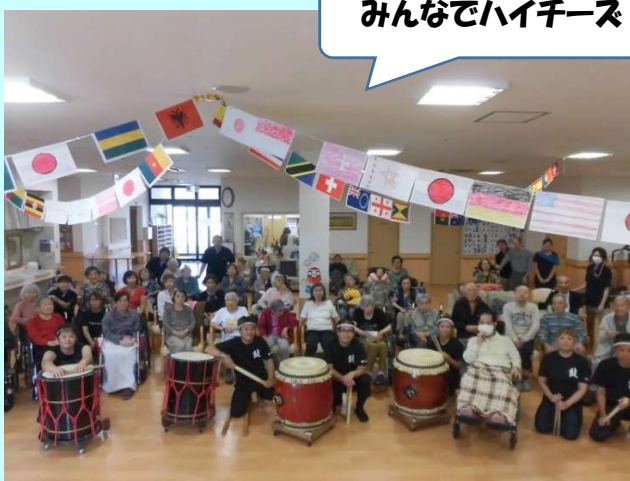
みんなでハイチーズ