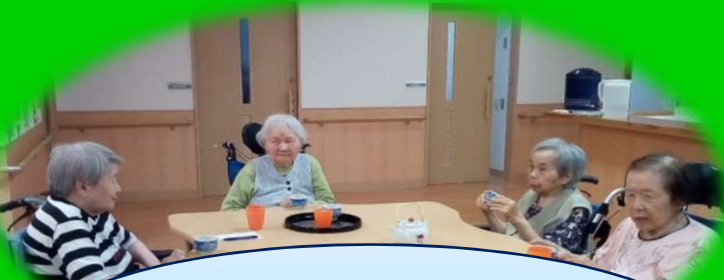
子供の頃のお茶摘み、懐かしいですね～