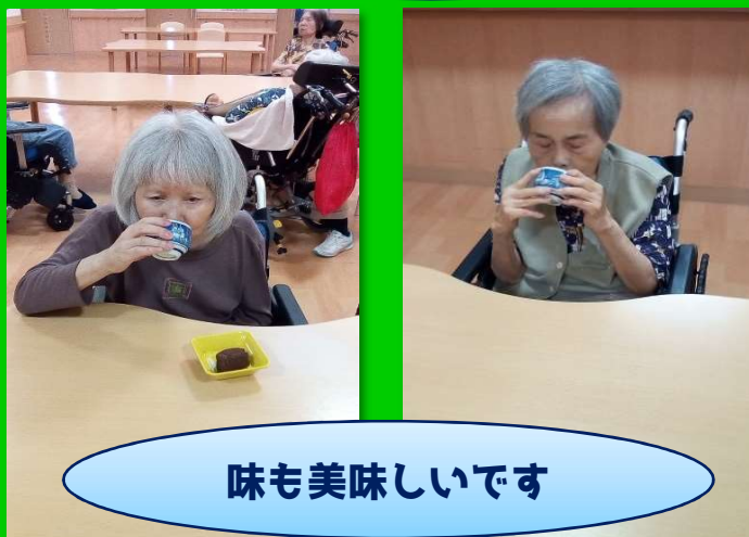
味も美味しいです