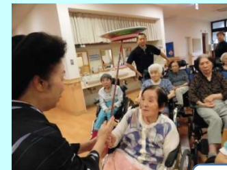
上手に回ってますかな？