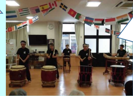
太鼓の音に聞き惚れます♡