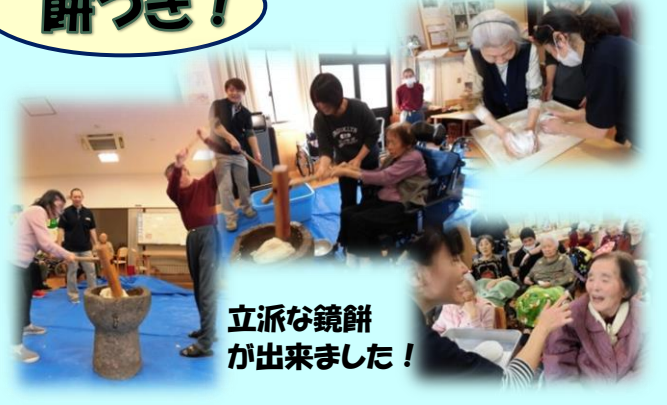
立派な鏡餅が出来ました！