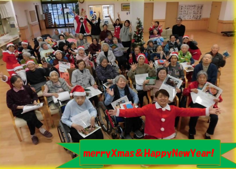
merryXmas & HappyNewYear!

旧年中は、ご利用誠にありがとうございました。本年もどうぞよろしくお願いいたします。