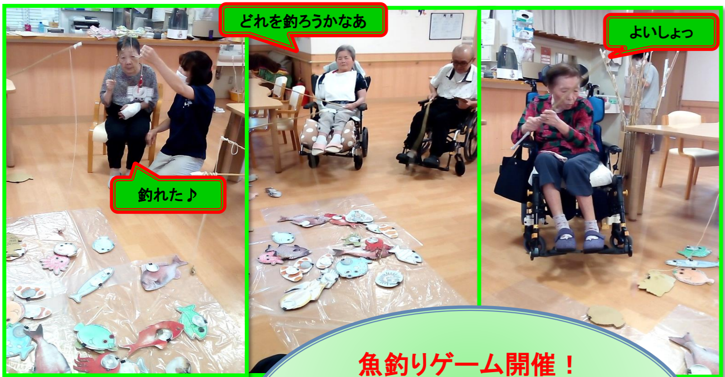
どれを釣ろうかなあ