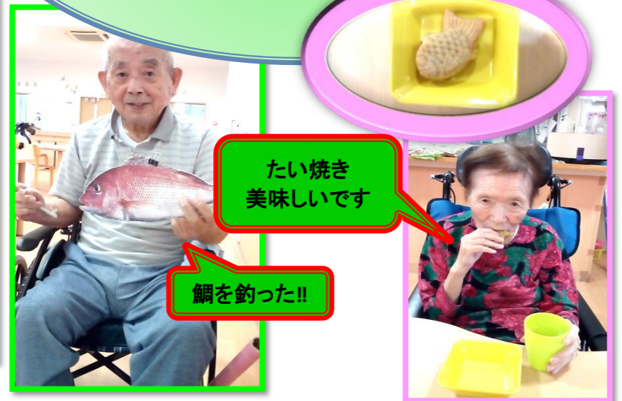
たい焼き 美味しいです