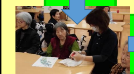
ビューティの時間 爪を切りましょう