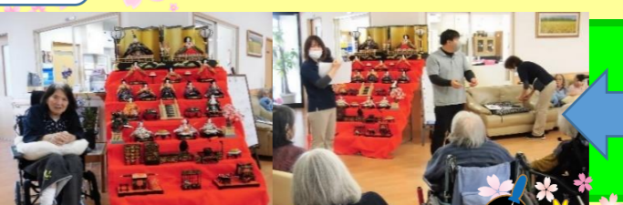
きれいに飾られたひな壇の前 でひな祭りイベント