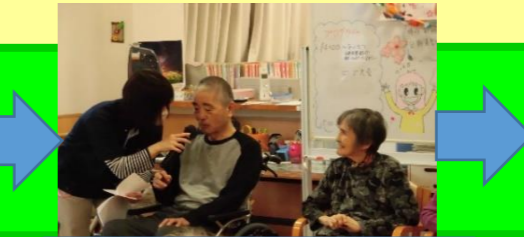
3月お誕生会 インタビューとビンゴゲーム!