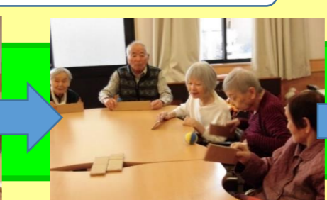
卓上ホッケー!! ボールを上手く打ち返そう!