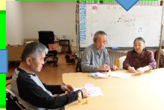
頑張っておられます。