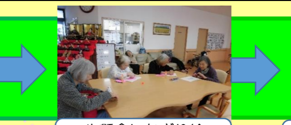
一生懸命にちぎり絵をされています。