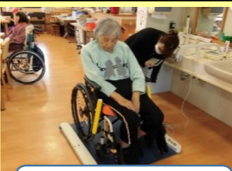
スタート! 月初めの体重測定