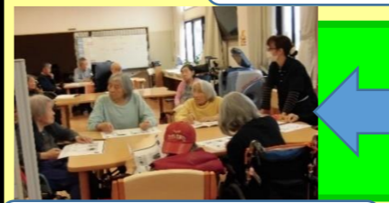
おとなの学校の授業風景 頭を活性化! 2コマすすむ