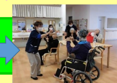
体操の時間。 手足をしっかり動かします。