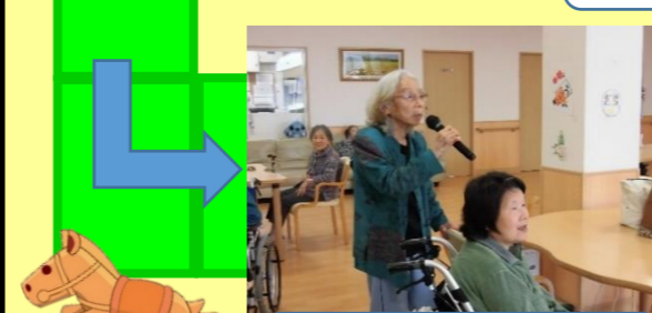
カラオケで熱唱! ノリノリで1コマすすむ