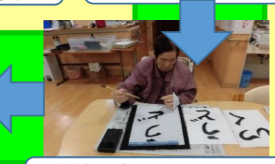
書道の時間 真剣に取り組んでおられます。