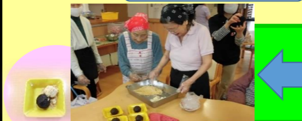
おやつ作り! 本日はぼた餅です。 つまみ食いはダメですよ。