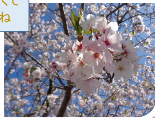
風が暖かくて気持ちいい

4月4日に園内散歩を行いました！！ ちょうど、桜も満開でした。コロナの影響でドライブは出来なかったですが・・・ 春風も心地よく「気分転換になるね」「外に出ると気分が違うね」等話され、笑顔が多くみられました