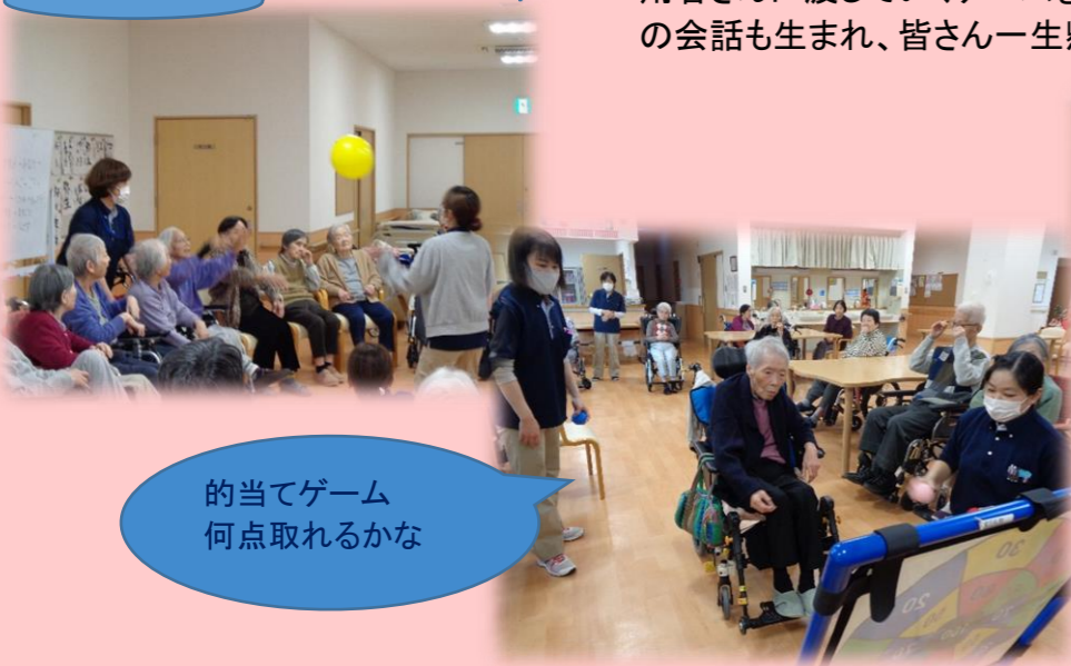
的当てゲーム 何点取れるかな

月に2～3回あるゲームのレクリエーション！！ 担当職員が内容を考え、的当てゲームや風船を隣の利用者さんに渡していくゲームをしました。利用者さん同士の会話も生まれ、皆さん一生懸命されていました(*^-^*)