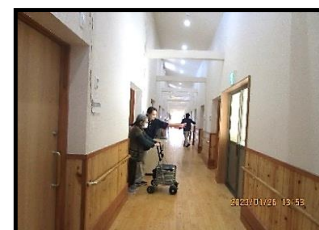
利用者様たちを避難誘導していきます

火災報知器発動。すぐさま現場に駆け寄り、出火していることを確認 消防署へ通報するスタッフと初期消火を行うスタッフに分かれます