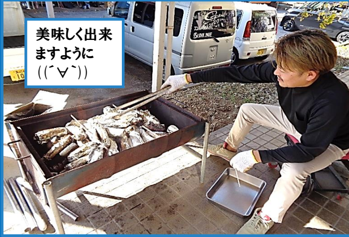
美味しく出来 ますように ((^v^))