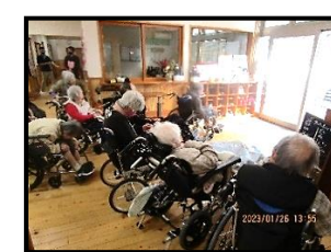
無事、全員が避難出来ました