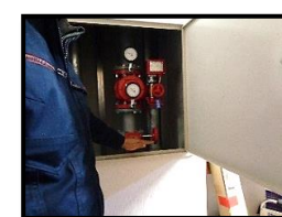
スプリンクラー、自動通報装置等の操作方法・誤作動時の取り扱いについて赤木防災より説いていただきました