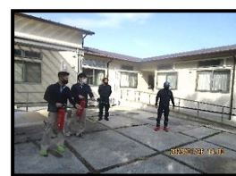
水消火器を使って消火訓練を行っています