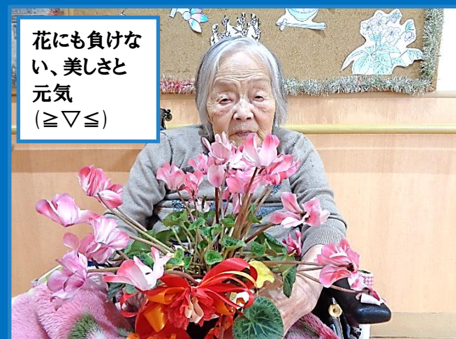
花にも負けな い、美しさと 元気 (≥▽≤)

今回は利用者様の日常をテーマにしてみました。 新型コロナウイルスが猛威を振るう中、日々の日常が変化し、 当たり前だった会って会話をすることが出来ず、利用者様や 御家族様に寂しい思いと不安な気持ちがあると思います。 今、自分達ができる事は、どうしたら利用者様が不安なく、 笑顔で毎日を送ることができるかだと思います。 本年も笑顔で頑張っていきましょう!