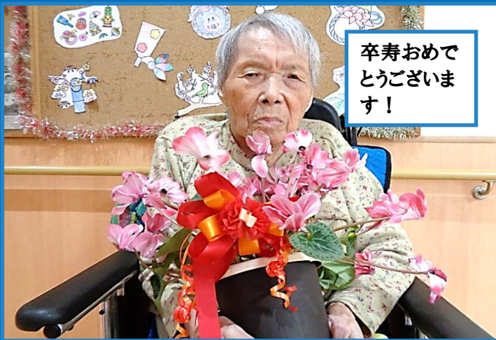
卒寿おめで とうございま す!