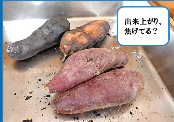
出来上がり、 焦げてる？